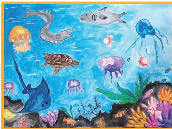
圖 / 蔡承勳（國小三年級）