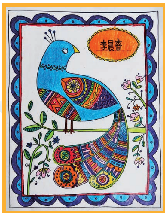
圖 / 李晨睿 (國小四年級)