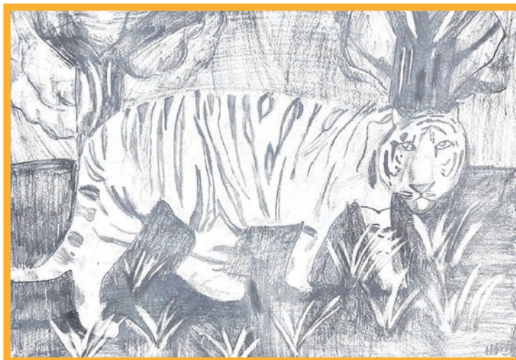
圖 / 綺綺 (國小三年級)