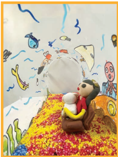
圖 / 李奕欣（國小二年級）