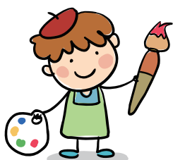
圖 / 睿睿（國小一年級）