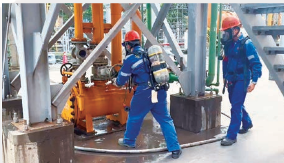
圖二、搶修組人員配戴空氣呼吸器進行搶修

煉鋼廠的安全生產離不開每位員工的努力和責任心。此次轉爐氣洩漏緊急應變訓練，不僅讓我掌握了應對突發事件的基本方法，更增強了我的安全意識和責任感。期待將這些所學應用於日常工作中，並與同事分享經驗，共同營造安全的工作環境，未來還能參加更多類似的訓練，不斷提升自己的應急處置能力，為工廠的安全運行貢獻一份力量。